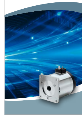
Control Power Line