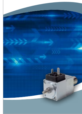
High Performance Line