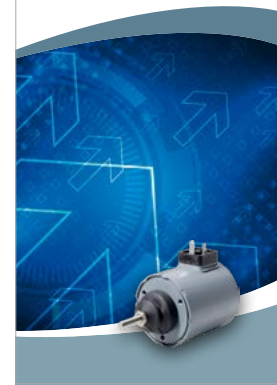
High Power Line