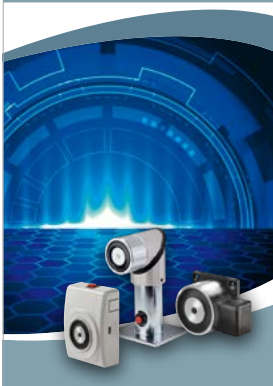
Hahn CQ Line